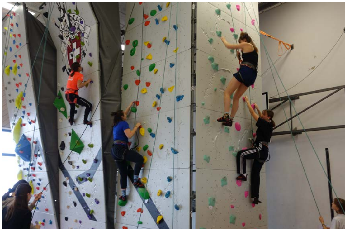
Die mobile Kletterwand des SAC in der Sporthalle von Hofwil. Klettern als Schwerpunkt im Sportunterricht während drei Wochen im Dezember fand viel Anklang.